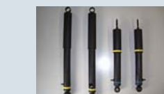
ネオチューン SPLセッティング ¥21,000

1BOXネットワークからリリースされた乗り心地を劇的に改善するリーフスプリングです。極めてワゴンに近い上質な乗り心地をご提供いたします。