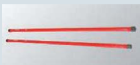
強化トーションバー ¥31,290～

大きな車体のハイエースはロールを誘発します。コーナーだけでなく直進時のふらつきにも効果あり。スタビリンクの交換だけでは満足できない方へ。