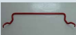
強化スタビライザー ¥31,500～

ミッションやプロペラシャフトにダメージを与えない角度付のブロックや下重量の軽減が可能な軽量ブロックも差額のみでお選びいただけます。