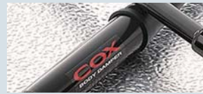
COXポディーダンパー ¥99,750

トーションバーを緩めるロードダウンでバネレートの低下が気になる方へ。フロントのロードブロックでは補えないバネレートの低下を回復させます。