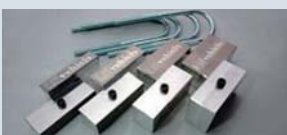
各種ロードダウンブロック ¥10,000～

積荷物の重量や乗車人数に依りて最適なセッティングが可能です。好みの乗り心地をオーダーして下さい。