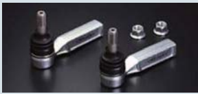
タイロッドエンド ¥27,300

ロードダウンによってスレてしまったジョイントを補正してサスペンション本来の機能を取り戻します。 ※タイロッドエンドと併用がオススメです。