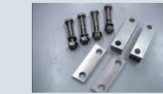
フロントロードブロック ¥22,050

特殊なダンパーの減衰力により衝撃や揺れを吸収、分散させ乗り心地やハンドリングを飛躍的に向上させます。