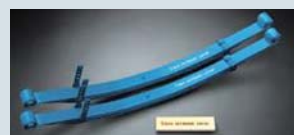
コンフォートリーフ ¥84,000

1BOXネットワークからリリースされた乗り心地を劇的に改善するリーフスプリングです。極めてワゴンに近い上質な乗り心地をご提供いたします。