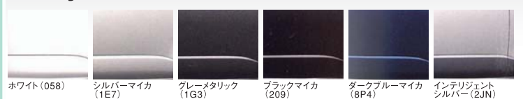
ホワイト (058) シルバーマイカ (1E7) グレーメタリック (1G3) ブラックマイカ (209) ダークブルーマイカ (8P4) インテリジェントシルバー (2JN)