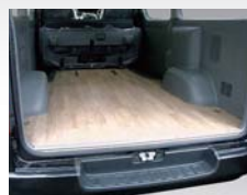
フラットフロアー