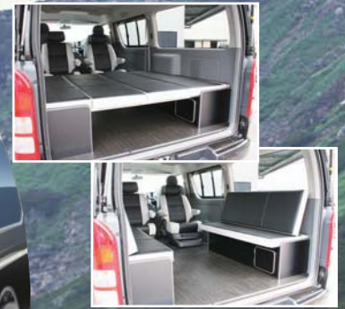
インテリアレイアウト