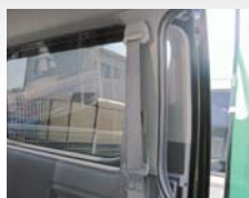
セカンドシートシートベルト