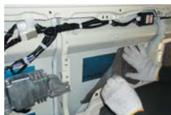
PhaseI スライドドア・サイドパネル