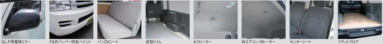
GL-P用電格ミラー F&Rバンパー同色ペイント バンDXシート 成型トリム 6スピーカー Wエアコン・Rヒーター (個別吹き出し口) センターシート (フロント) フラットフロア