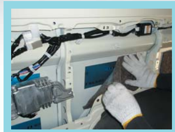
PhaselI スライドドア・サイドパネル